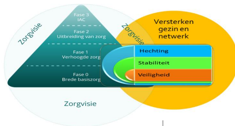
Figuur 2: Traumasensitieve zorg in het zorgcontinuüm.

Ook als het gaat om leerlingen met een vluchtverhaal biedt het zorgcontinuüm een kader waarbinnen de leerkracht en de school samen met het CLB de zorg voor deze leerlingen kunnen opnemen (Figuur 2).